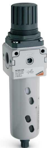
Фильтр-регулятор (изображение может отличаться)

5.2.6. На трубопроводе сжатого воздуха установить фильтр-регулятор с шаровым краном за ним. Место установки фильтра регулятора выбрать таким образом, чтобы к нему был доступ для осуществления настройки и контроля давления сжатого воздуха. На регуляторе выставить давление 6 бар.