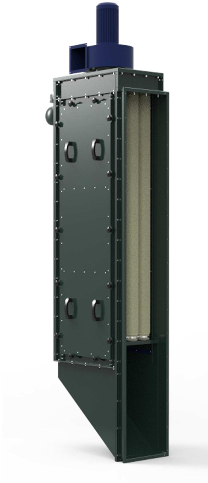
Фильтр локальный СРФ-ЛЗ в вертикальном исполнении