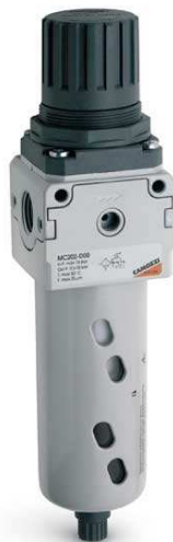
Фильтр-регулятор (изображение может отличаться)

5.2.5. На трубопроводе сжатого воздуха установить фильтр-регулятор с шаровым краном за ним. Место установки фильтра регулятора выбрать таким образом, чтобы к нему был доступ для осуществления настройки и контроля давления сжатого воздуха. На регуляторе выставить давление 6 бар.